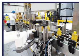
vullen - etiketteren