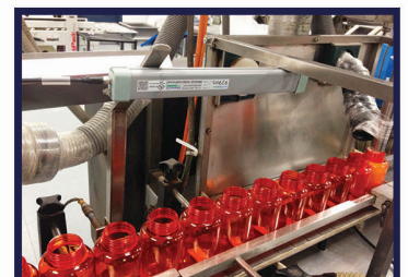
lekdetectie - vullen