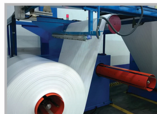
extrusie - opwikkeling